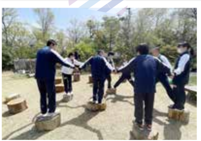
2年生校外学習 (4月12日) スポーツ健康コース びわこ成蹊スポーツ大学見学