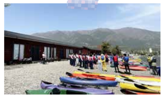
1年生校外学習 (4月13日) BSC ウォータースポーツセンター