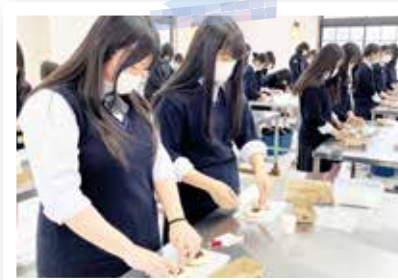
2年生校外学習 (4月12日) 生活デザインコース ローザンベリー多和田