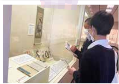
2年生校外学習 (4月12日) 総合進学コース 大津市歴史博物館、町散策