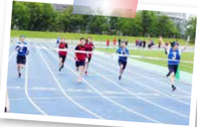
体育祭2日目 (6月15日) 皇子山陸上競技場