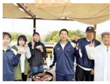
3年生校外学習 (4月12日) ネスタリゾート