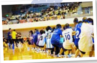
体育祭1日目 (6月14日) ウカルちゃんアリーナ